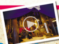
高祖大師正当の模様