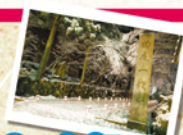
大晦日 永平寺の正門