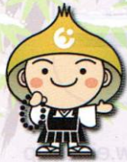
えい坊くん 永平寺イメージキャラクター