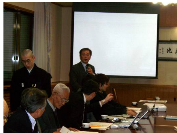
第3回『禅の里』づくり実行委員会の様子