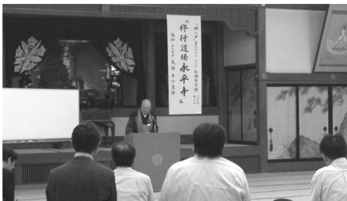
大場単頭による勉強会の様子