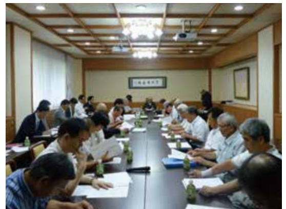
第16回「禅の里」まちづくり実行委員会