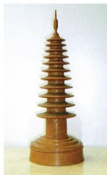
初代・二代光月作