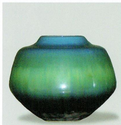
三代徳田八十吉作 九谷焼壺類