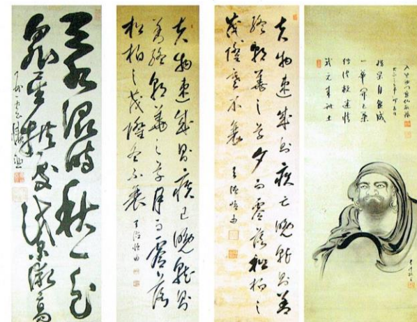
大本山永平寺歴代禅師遺墨