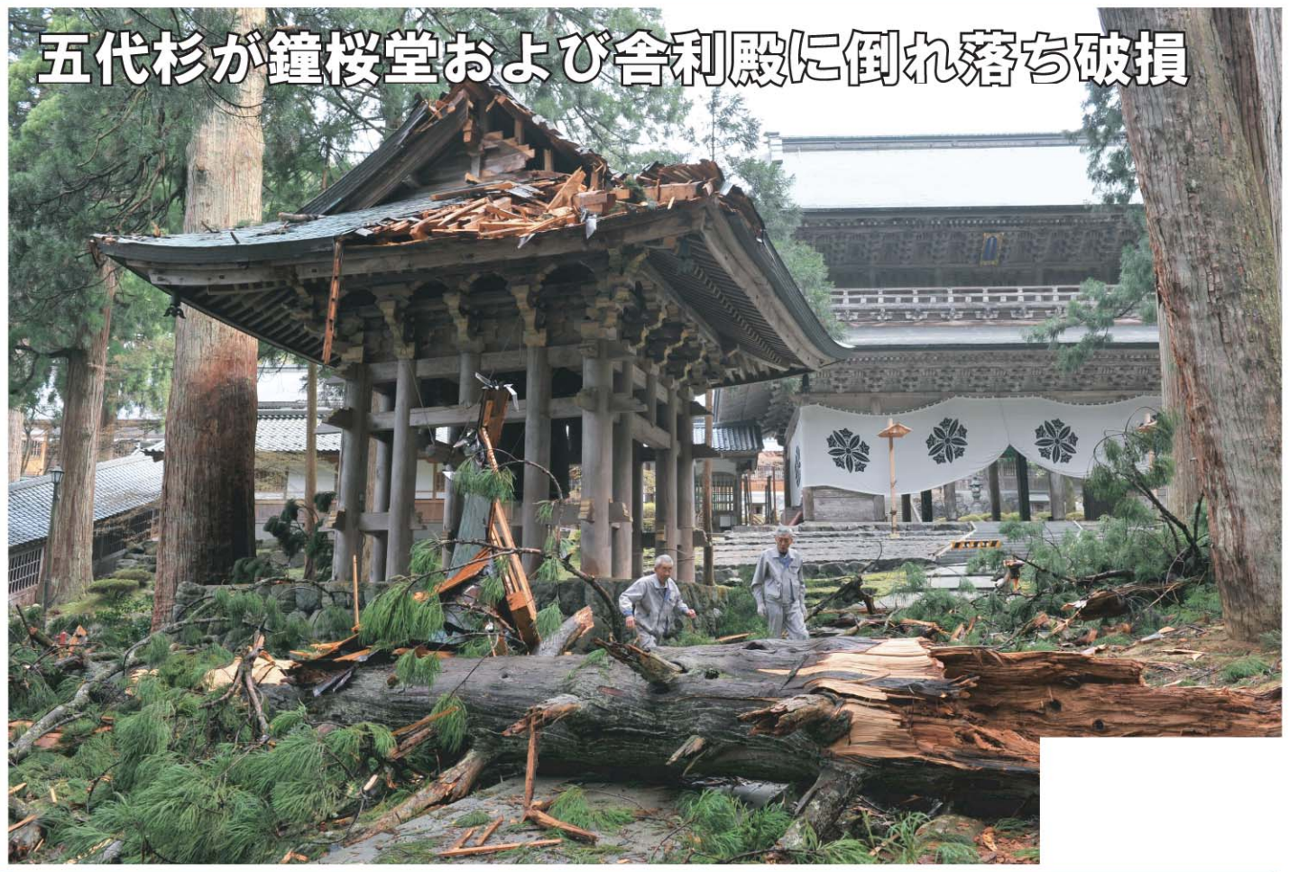
五代杉が鐘楼堂および舍利殿に倒れ落ち破損

平成22年4月27日、山門前に並ぶ巨大な五代杉の1本が強風により幹折れし、鐘楼堂および舍利殿に倒れ落ち破損する事故が発生しました。 これを機に、委員会を設置し、スギの調査や倒木に対する保全対策が行われています。この対策を実施する上で現在の「永平寺の森」が有する自然の環境条件や、自然災害に係る課題・問題点を抽出し、自然災害への防災対策としての土木施設等の現状把握など環境保全及び安全・安心という観点から調査を行っています。